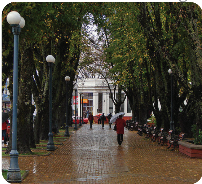
Imagen Objetivo Comuna de Angol